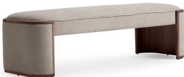
Grasse sabbia e noce americano. Grasse sabbia leather, american walnut.