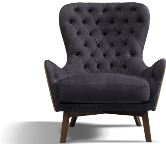
Pelle in kashmir denim, base in noce Americano. Kashmir denim leather, American walnut base.