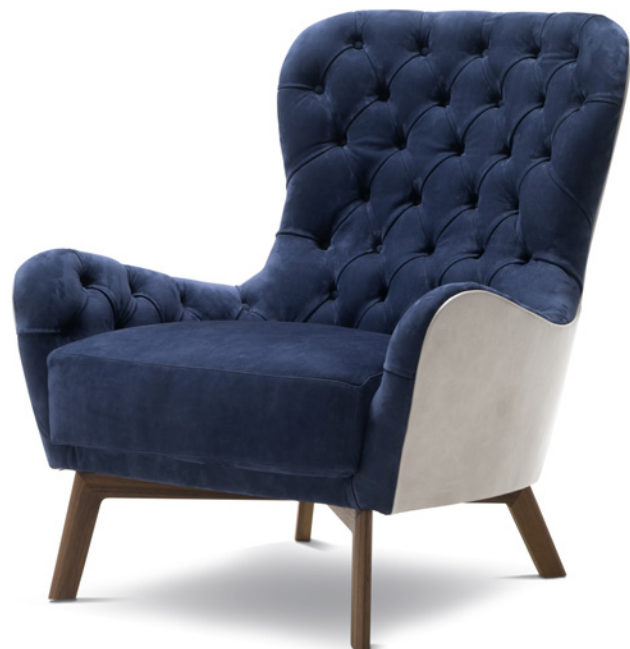
Davanti in pelle in nabuk blu, dietro in pelle river pomice. Front in nabuk blu, back in river pomice leather.