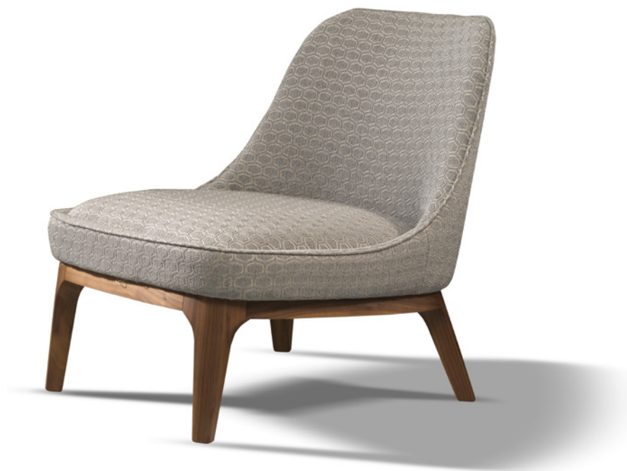
Tessuto com. Com fabric.