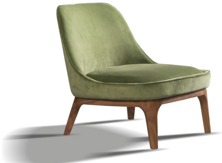
Tessuto cat. elegant art. incisa. Fabric cat. elegant art. incisa.